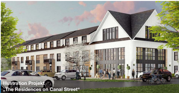
Illustration Projekt „The Residences on Canal Street“

„The Residences on Canal Street“ ist als ein Ensemble von fünf Gebäuden mit jeweils drei bis vier Stockwerken geplant. Die Apartmentanlage ist mit, für das „Class-A“-Segment üblicher, gehobener Ausstattung und Service geplant.